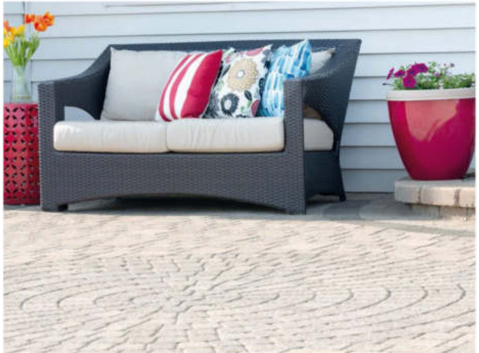
Stand: Mai 2019

Wenn Herbstlaub, Grasschnitt vom Rasenmähen oder Düngerreste anfallen, sollten Sie ihrer Terrasse bzw. ihren befestigten Flächen besondere Aufmerksamkeit schenken. Durch die Zersetzung und den Abbau der organischen Substanz aus Laub oder Gras entstehen Gerbsäuren, die in die Steinoberfläche einziehen und zu unschönen Verfärbungen führen können. Diese Verfärbungen sind unter Umständen dauerhaft und lassen sich häufig nur mit erheblichem Aufwand beseitigen bzw. vermindern.